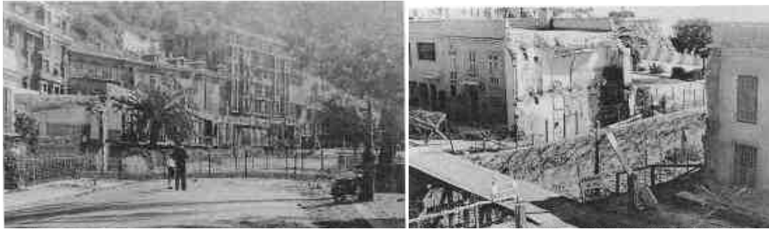
La colline du château et la tranchée antichar du quai des états unies