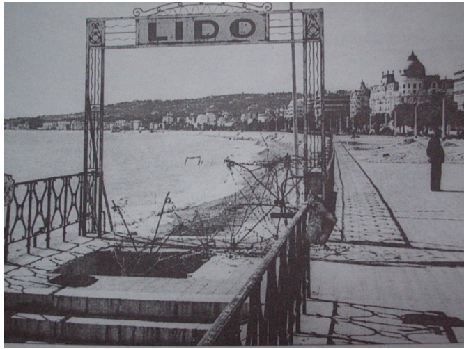
La plage du Lido