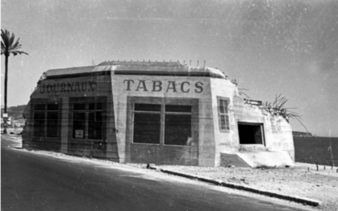
Casemate sur la promenade avant et pendant sa destruction