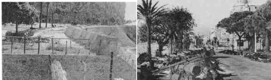
La tranchée et la promenade