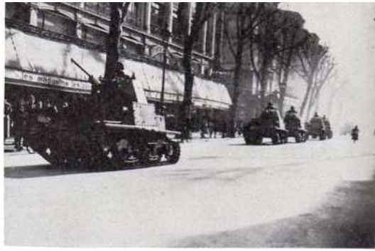
chars italien L6 dans nice les mêmes sur l'avenue jean medecin