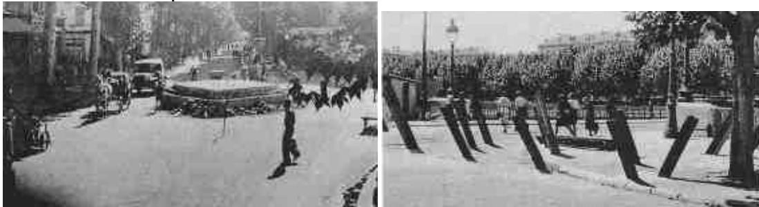
L'avenue Jean Médecin le paillon et les rails antichar